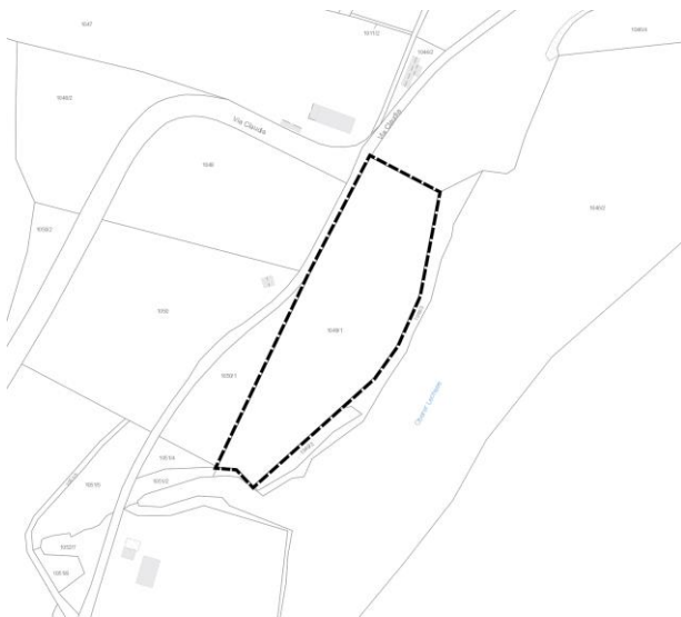
Abbildung 1: Geltungsbereich der gegenständlichen Flächennutzungsplanänderung, unmaßstäblich

Im Einzelnen gelten die Lagepläne vom 01.08.2023. Die Lagepläne sind in folgenden Kartenausschnitten dargestellt: