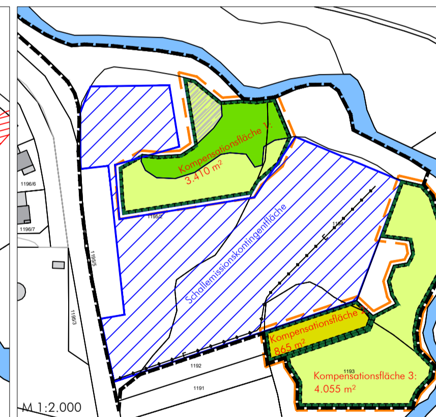
Schallkontingente und Kompensationsmaßnahmen